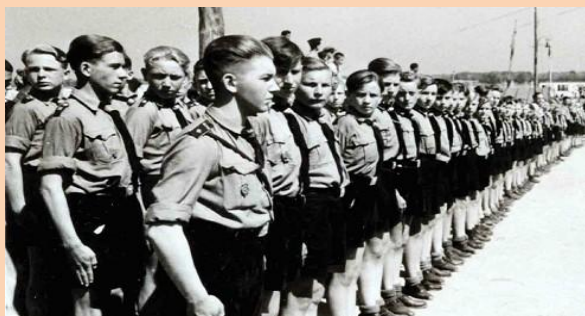
„Hitlerjugend” – młodzież Hitlera