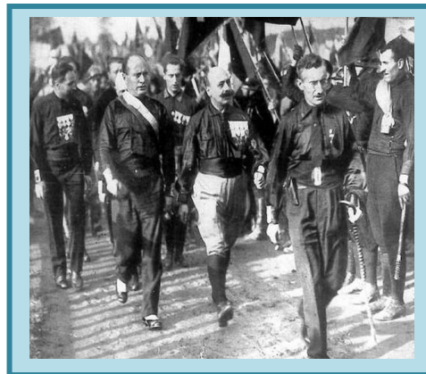
Marsz na Rzym